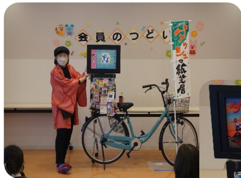
「ヤツサン一座」の紙芝居、みんなで楽しく見せていただきました。