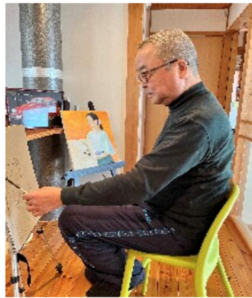
描く人の人となりが現れてくるのが絵画の魅力です。

大阪福祉事業財団や後援会の方ともお付き合いをさせて頂いていました。組合専従として、財団分会の泊まり込みの学習会にも何度か参加をさせて頂きました。人生においての大きな出来事があれば教えてください。