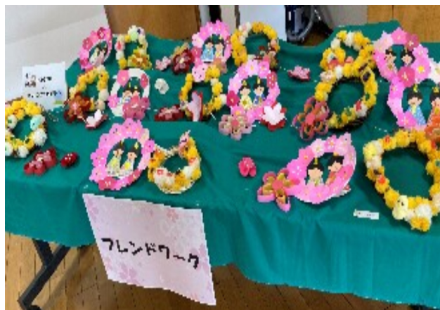
フレンドワークの作品 「ひなまつりとポンポンたんぼぼリース」(上)