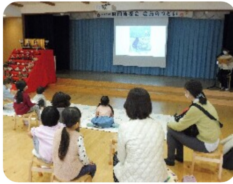
絵本シアターの様子

コロナ禍で直接感謝を伝える機会が持てなかった中、今年度は2月17日(金)3年ぶりに対面で「後援会のつどい」を行いました。