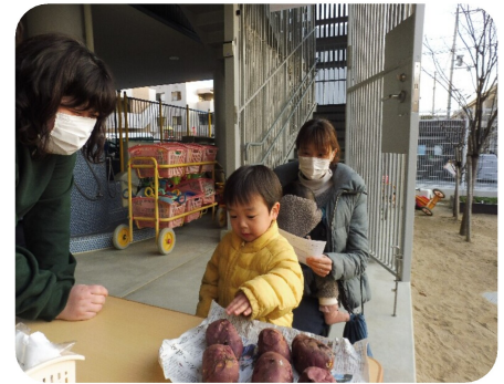
あっちいよ～ やきいもおいしそ～

たり観てもらいました。帰りには地域のお店に出張していただき、ホカホカの焼き芋と来年度の更新用紙も一緒に渡し、日頃の感謝と引き続きの支援の協力を呼びかけました。