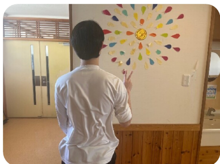
Kくん。不安もあるけど、楽しことをみつけたいと話してくれました。